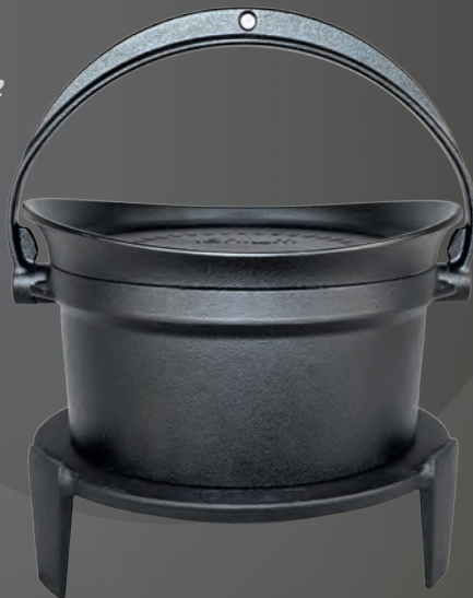
TARAN Camping Variante 2