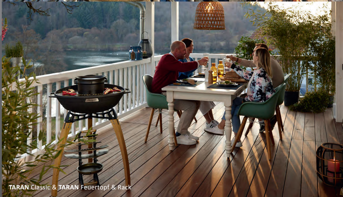
TARAN Classic & TARAN Feuertopf & Rack