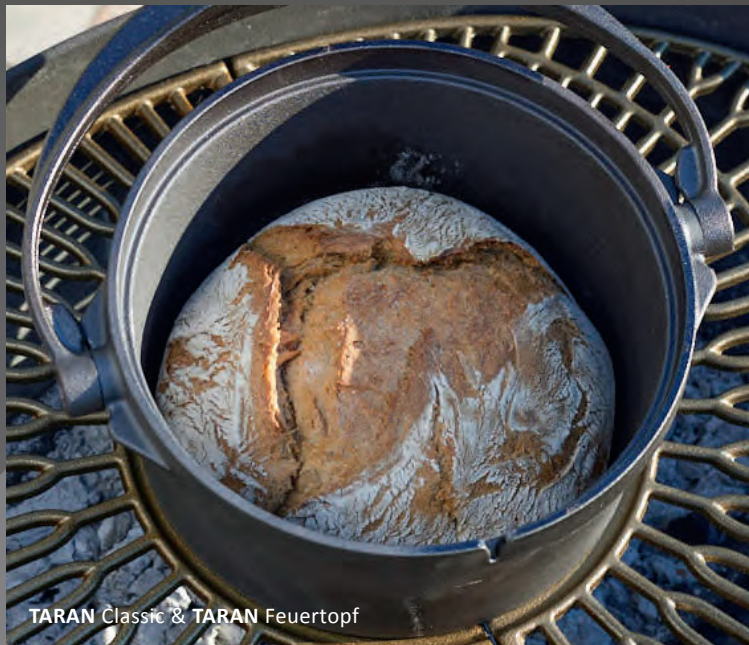
TARAN Classic & TARAN Feuertopf